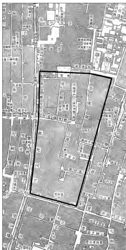
图一:南宋早期德寿宫址 据《杭州近旁图》改绘