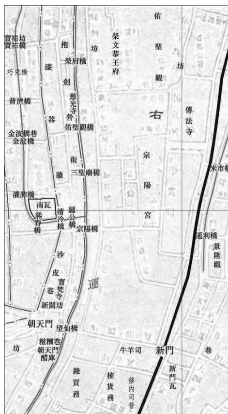
图二:南宋末期德寿宫址 《南宋临安城复原图》局部